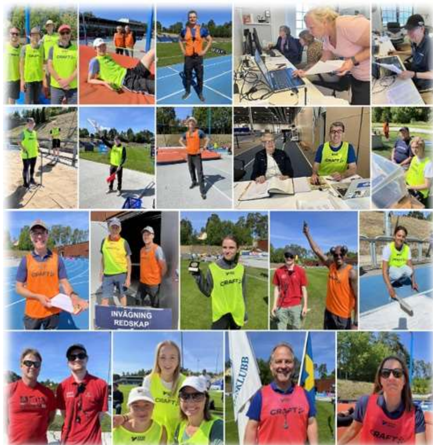
Collage över våra funktionärer vid tävling utomhus på Sollentunavallen

I alla de arrangemang som klubben har genomfört har klubbens medlemmar ställt upp som funktionärer. Det är ryggraden i att vi som en av Sveriges största friidrottsklubbar ska kunna genomföra arrangemang. Varje aktiv medlem ska ställa upp med minst två till fyra funktionärsdagar under ett år. Stort tack till alla er som var med och genomförde uppdragen!