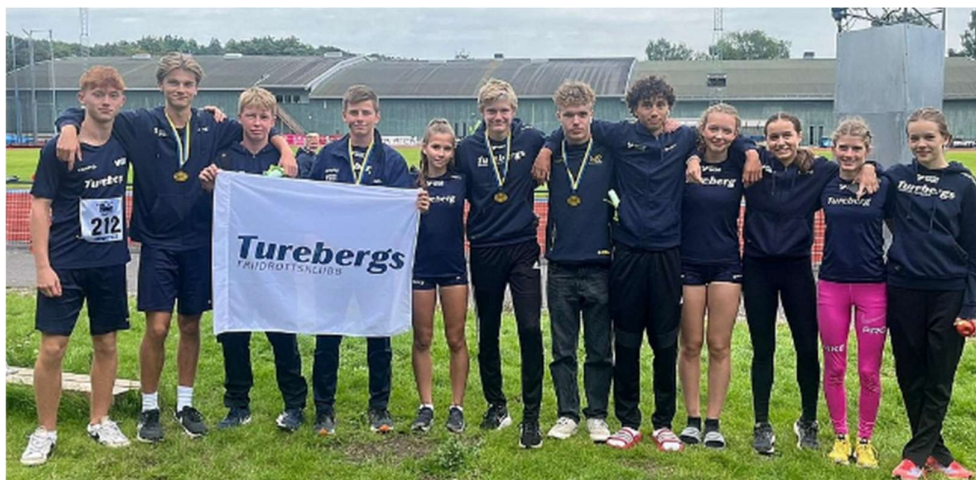
Delar av laget i Kraftmätningen 15 år som tävlade på LidingövalLEN

Väldigt många barn i träning har lett till att Tureberg varit största klubb i Stockholm i Regionmästerskapet "Svealandmästerskapen" där de födda 2009-2010 tävlade inomhus i Sättra i mars. Regionsmästerskapet utomhus 2023 gick i Märsta.