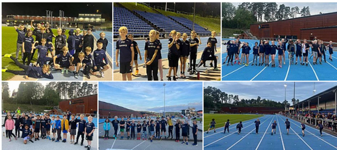
Blider från KM 7-11 år utomhus med väldigt många glada Turebergare

I ålder 7-11 år har det också tävlats en hel del under året. Resultat publiceras inte för barn under 12 år enligt direktiven från Friidrottsförbundet. Vi ser en hel del tävlade i våra egna arrangemang.