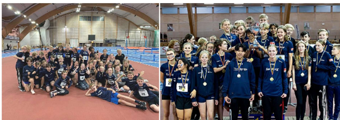
I Stockholmskampen för 12- och 13-åringar där alla Stockholmsföreningar möts under 4