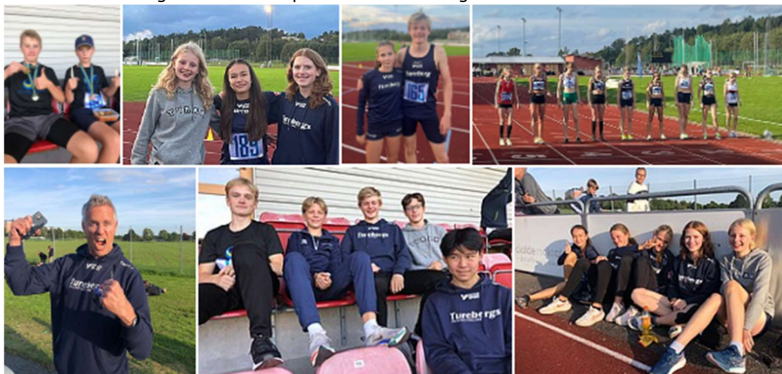
Några av våra Tränare och aktiva på plats i Märsta

Väldigt många barn i träning har lett till att Tureberg varit största klubb i Stockholm i Regionmästerskapet "Svealandmästerskapen" där de födda 2009-2010 tävlade inomhus i Sättra i mars. Regionsmästerskapet utomhus 2023 gick i Märsta.