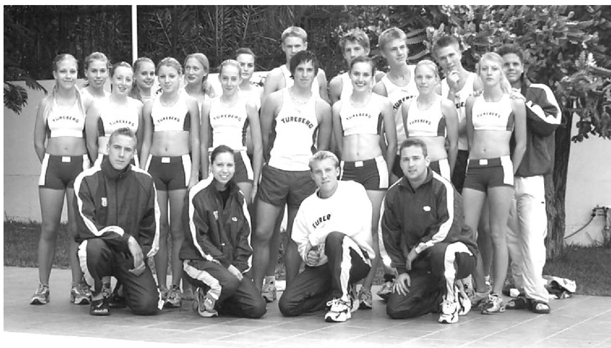
Träningläger på Gran Canaria i februari 2003